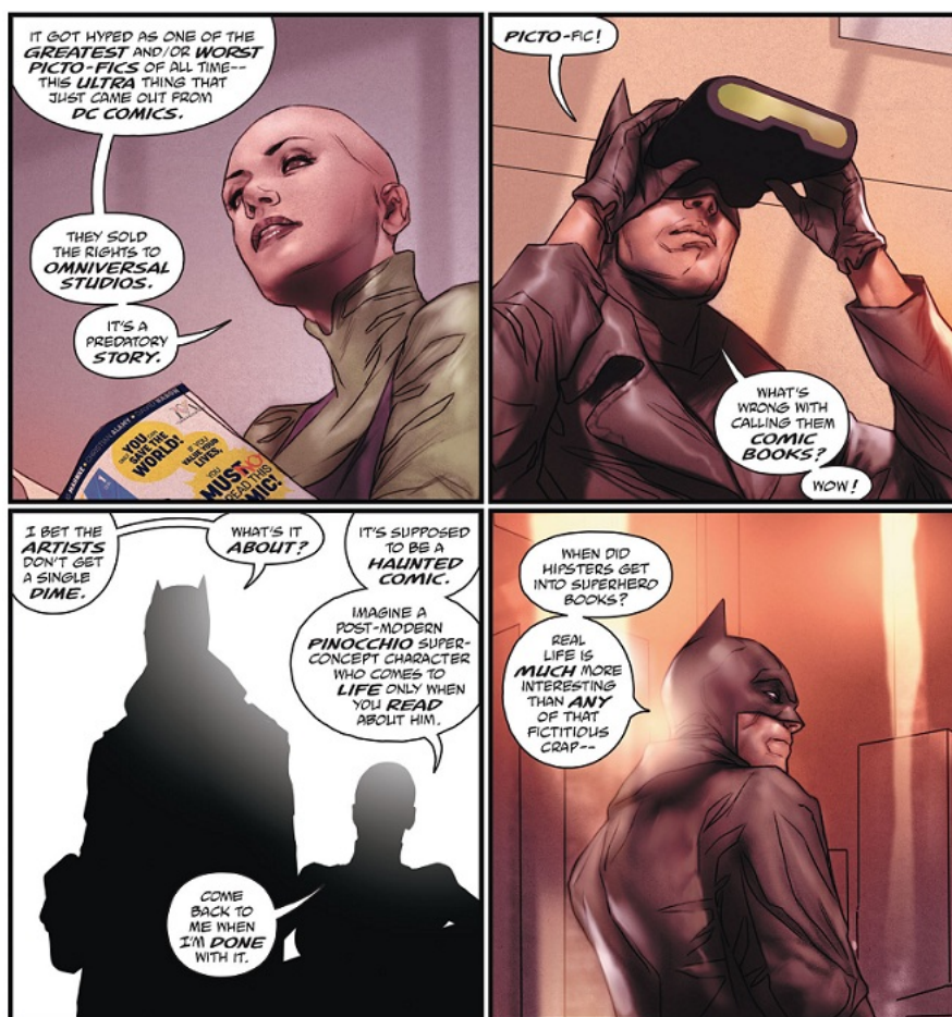
Fig. 2: Grant Morrison & Ben Oliver, The Multiversity: The Just #1 , página 6, paneles 2-5. ©DC Comics 2015

triunfado no hay nada que hacer . No hay nada que construir. En cierta manera no hay trabajo. Y que el problema no es la juventud de sus protagonistas sino simplemente la falta de opciones significativas que le den sentido a una vida. Lo cual dobla como una crítica bastante dura de la idea del superhéroe: ¿Qué queda luego de su éxito más que el fin de la historia, el fin de la utilidad, el fin del conflicto, reemplazado por micro-peleas entre personalidades?