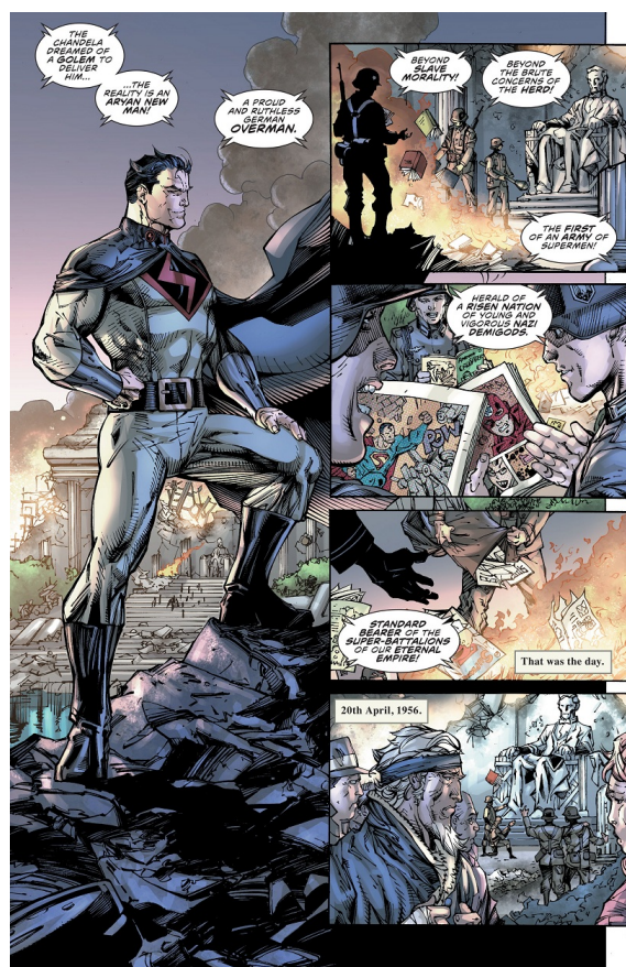
Fig. 7: Grant Morrison & Jim Lee, The Multiversity: Mastermen #1 , página 10. ©DC Comics 2015

y Dorfman, es una respuesta a los críticos que ven en los superhéroes simplemente el ejercicio de la fuerza brutal y el estado policiaco, el capitalismo siempre idéntico a sí mismo y la dominación cultural. Morrison lleva esa idea a su lógica conclusión. Y lo que propone es un mundo estéril, perfecto pero abandonado, carente de creatividad, que sigue copiando las formas y las referencias culturales de un nazismo de mitad de siglo, Wagner, la arquitectura monumental de Speer, que no ha producido nada nuevo. Y es perfecto y apropiado que ese mundo esté dibujado por Jim Lee, que con su grafismo funcional y a esta altura carente de lo que lo hizo distintivo en los 90s al haberse convertido en el "estilo de la casa" de DC, con sus líneas rasguñosas y su arquitectura de ningún lugar, transmite de forma perfecta esa utopía muerta.