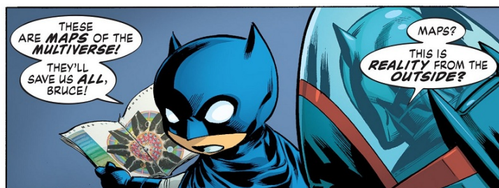
Fig. 5: Grant Morrison & Marcus To, The Multiversity: Guidebook #1 , página 23, panel 5. ©DC Comics 2015

se preguntaron qué curioso que es que un mapa y un dibujo sean más o menos lo mismo? ¿Qué un mapa de un territorio ficcional, como Oz o Gotham, esté creado de lo mismo de lo cual están hechos los eventos que suceden allí dentro? No es exactamente que el mapa es el territorio, sino que su esencia constitutiva es idéntica, y que la diferencia representativa descansa en los distintos grados de abstracción y en los diferentes niveles de observación.