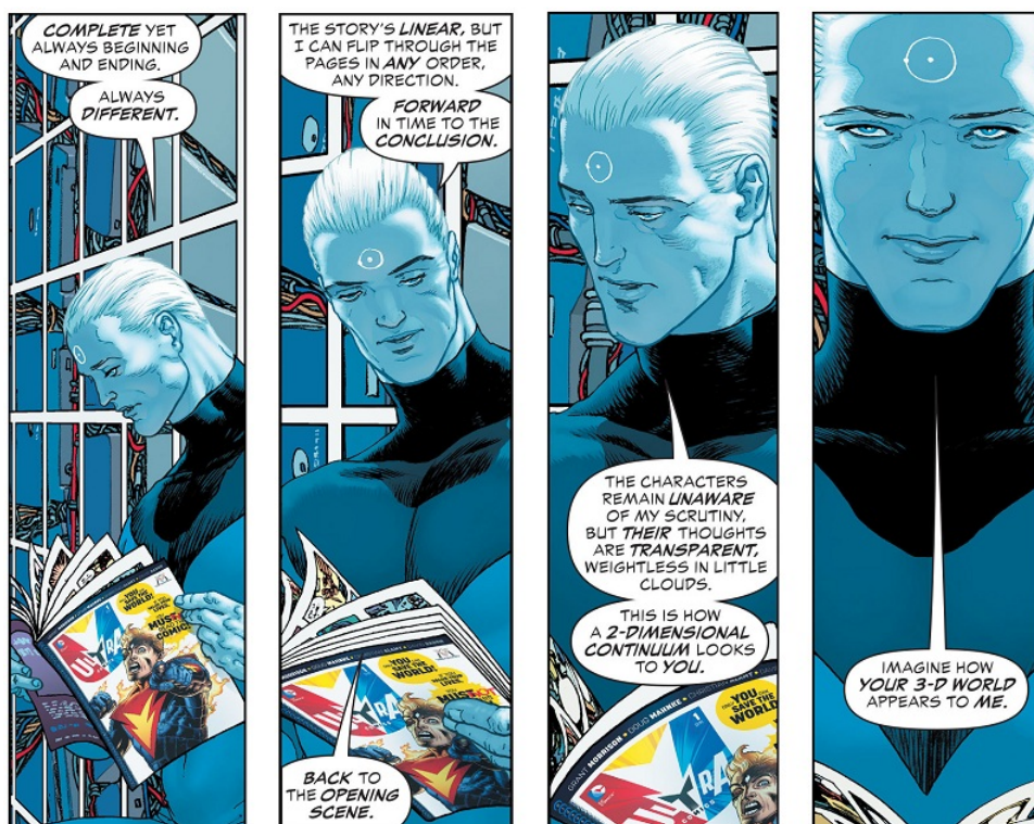
Fig. 3: Grant Morrison & Frank Quitely, The Multiversity: Pax Americana #1, página 14, paneles 6-9. ©DC Comics 2015

de Sivanas, que también reflejan la oscuridad que un concepto puede llegar a adoptar, con ese Sivana-Lecter que solo quiere violar a Mary Marvel y que parece una velada crítica a la DC de Didio de principios de los 00s. Y también propone que la muerte de la magia, reemplazada por la ciencia oscura de Sivana, se parece demasiado a un trabajo de oficina de 8 horas. A simple vista, otra vibrante llamada a las armas para las huestes de la creatividad pero: ¿de dónde surgen los productos de la imaginación sino en la diaria maquinaria de sentarse y escribir o dibujar, muchas veces más que ocho horas, en soledad? No hay que confundir lo creativo con lo simple ni con la panacea, parecería decir Thunderworld .