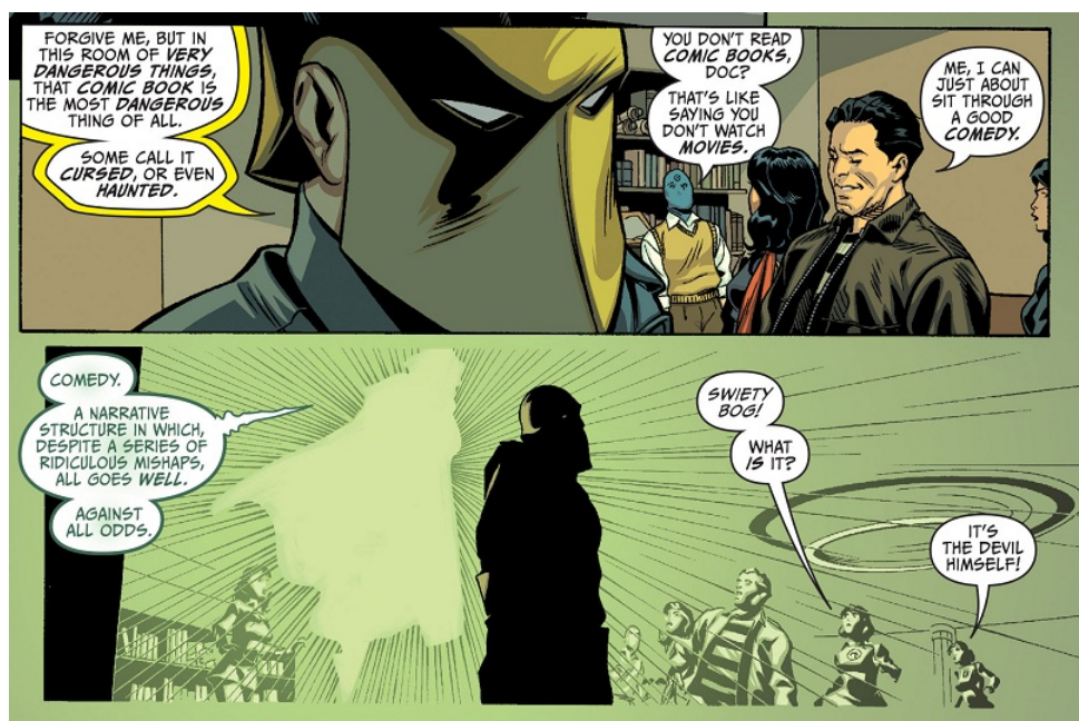
Fig. 1: Grant Morrison & Chris Sprouse, The Multiversity: Secret Society of Superheroes #1 , página 6, panel 4-5. ©DC Comics 2015

de hombres grandes y cansados para los cuales el género era simplemente otro trabajo. Algo de ese pragmatismo permea SOS . Y, sin embargo, cuelga como una sombra del futuro la moralidad tradicional del superhéroe. La invasión de la tierra espejo funciona como la Gran Guerra, el fin de las ilusiones, la conversión del superhéroe en una serie de reglas como "no matarás". Después de todo, pierden cuando asesinan.