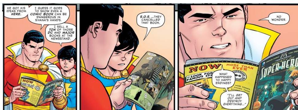
Fig. 4: Grant Morrison & Cameron Stewart, The Multiversity: Thunderworld Adventures #1 , página 38-39, paneles 4-6. ©DC Comics 2015

lectura para nerds. Como organización de fichas y datos. Como búsqueda de un orden imposible. 7 El Guidebook funciona como eso: saturación informativa y búsqueda de conexiones. Algunos lo criticaron porque era un relevamiento de variaciones dentro de un espectro cuando podría haber sido tanto más: todas copias de Superman, Batman y Wonder Woman. Pero la gracia es esa: por un lado porque ya no es el trabajo de Morrison inventar nuevos personajes viables por los cuales no va a ver un centavo en el largo plazo, por otro lado porque cuando la repetición de un tema se vuelve tan fructífera, como aquí, se transforma en algo nuevo y demuestra su riqueza. Encontrar las versiones espejo de remezclas de los principales personajes de DC, como en la tierra basada en Image a principios de los 90s, o en aquella construida sobre Astro City, o sobre Big Bang Comics, pone en evidencia un trabajo de distorsión hasta un horizonte en el que lo permanece es un vago arquetipo cuyo diseño y propósito son eternamente mutables.