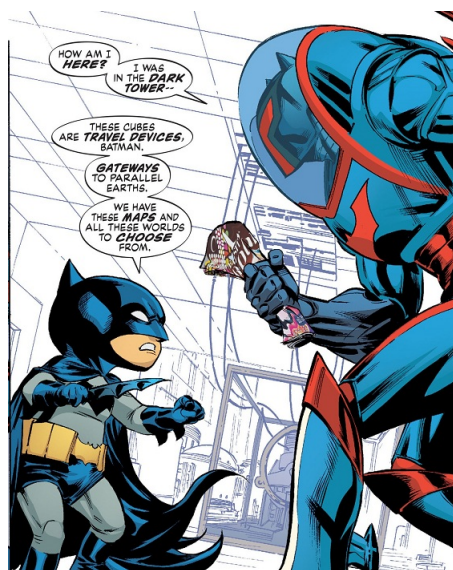
Fig. 6: Grant Morrison & Marcus To, The Multiversity: Guidebook #1 , página 26, panel 2. ©DC Comics 2015

Luego viene Mastermen , que es la reflexión del superhéroe como fascista y como comentario político. Como si Morrison hubiese leído a Eco, Mattelart