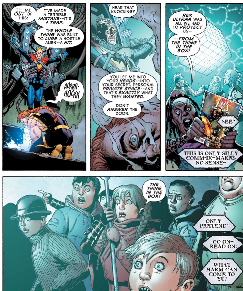
Fig. 8: Grant Morrison & Doug Mahnke, The Multiversity: Ultra Comics #1 , página 33, paneles 1-4. ©DC Comics 2015

Gentry de alguna manera procede de nuestra Tierra, de la Tierra 33. Es, una vez más, como en Seven Soldiers o Seaguy , una reflexión sobre como la materia de nuestros sueños se transforma en pesadilla. Esto lleva a ciertos juegos y experimentos bastante efectivos con la lectura y la manera de pasar las páginas en el comic, que culmina con la orden de Intellectron de "Turn the page, slave", algo que obviamente vamos a hacer porque queremos llegar al final de la historia. Y llama la atención a algo que transcurre por debajo de toda la historia y que es la relación entre los actos de la imaginación, los personajes, los creadores y los lectores.