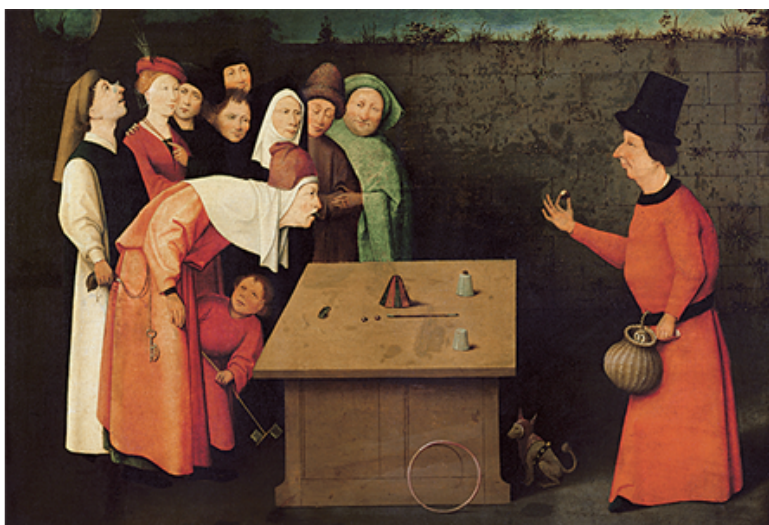
Fig. 1: El prestidigitador , El Bosco, ca. 1480

adicional por los alcances y límites del sujeto, problematizada en las recurrentes alusiones a la idea de una vida reducida al cumplimiento de un destino y las posibilidades (o no) de alterar su curso mediante la acción.