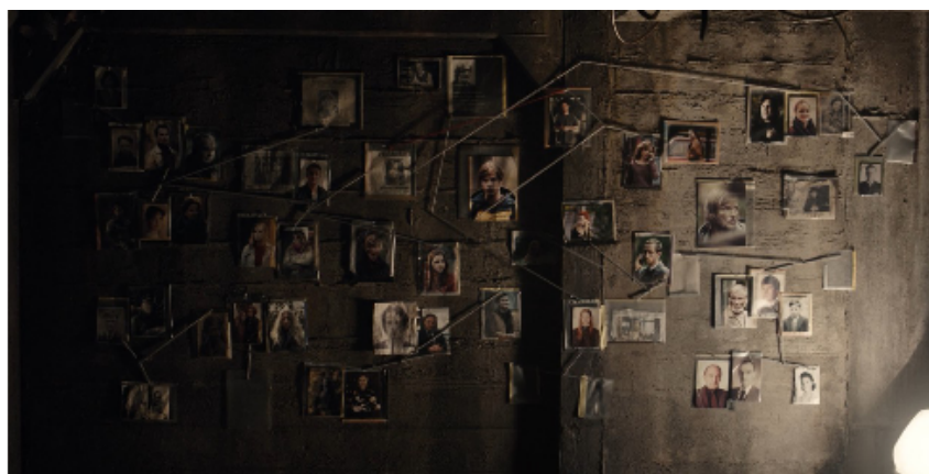
Fig. 5: Todo está conectado

Claudia afina su texto y diseña una trama. Vemos la gestación de una de sus escenas: asegurarse de que lleven a Mads “al lugar donde tienen que encontrarlo”.