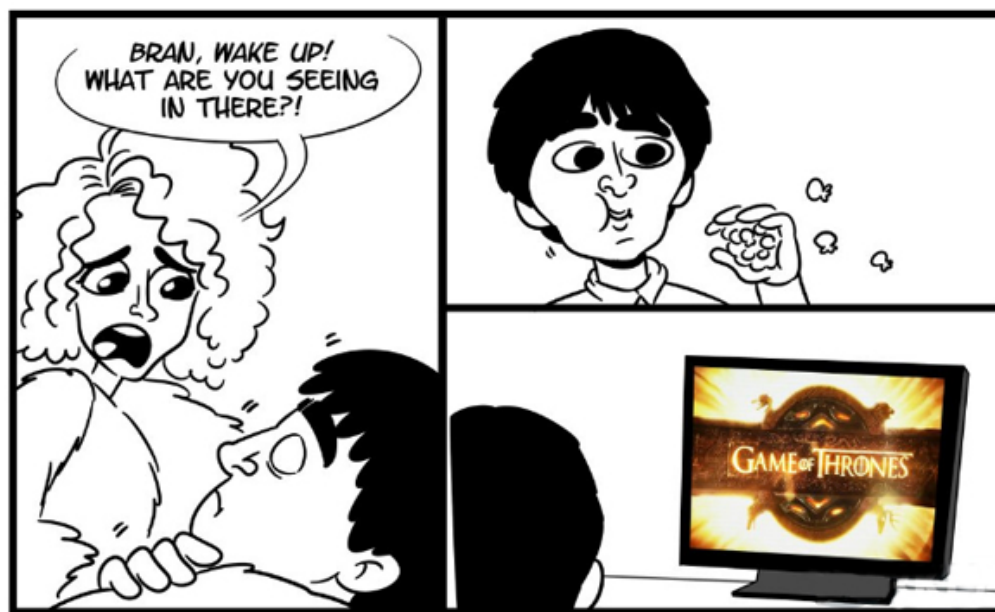
Fig. 3:

dark words es una de las frases más repetidas de la saga (al punto de que algún usuario de Reddit también la denuesta). Los árboles acumulan información que es accesible directamente mediante la conciencia. Luego, esto deja de ser posible y solo quedan los libros como expansores artificiales del punto de vista.