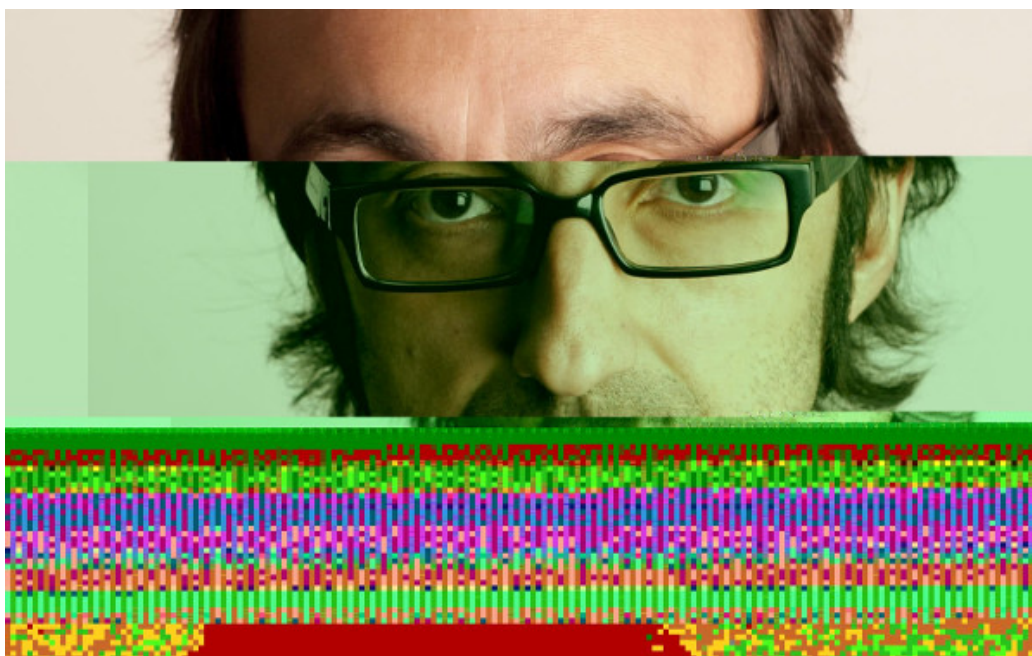
Fig. 1: Retrato de Agustín Fernández Mallo intervenido digitalmente, cifrando el texto de distintas versiones del artículo y algunas de sus poesías en la codificación de la foto.

La astrofísica define “horizonte de sucesos” como el espacio fronterizo, el límite, de la influencia gravitatoria de la singularidad que es un agujero negro. En cierto sentido, el horizonte de sucesos es en sí una singularidad, un espacio intermedio como la hipotética caja de Schrödinger en la que un gato estaba vivo y muerto al mismo tiempo. Ante el apabullante desarrollo tecnológico de las últimas décadas, el ecosistema literario ha devenido una tal singularidad. Más allá de la superficialidad instrumental de nuevas herramientas de escritura, distribución y lectura existe un estrato conformado por cambios y tensiones en la percepción de la experiencia, de la concepción del tiempo y el espacio, de la extensión de “lo digital” o de la especificidad lingüística de la literatura y sus mutaciones a partir del contacto con soportes, tradiciones y lenguajes. En una coyuntura de relativo impasse de los estudios literarios queremos presentar una constelación de conceptos y autores que, creemos, pueden ser operativos para interpelar la literatura.