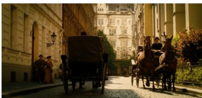
De la Londres de The Prestige (2006) a la Viena de The Illusionist (2006): ¿sólo una elección cinematográfica?

mundo en la categoría "segunda mitad del siglo XIX" no se actualice en nuestra imaginación más que como un puro saber, que vendría a ocupar esa "zona de penumbra" (según diría un Thomas Pavel [1986]) en que se difuminaría el mundo altamente saturado y cohesivo de la ciudad baudelairiana. 2 Puesto que, así como "el salón" o "el passage" no implican una mera especificación de "la ciudad moderna", la alusión a las dos "mitades" del siglo evoca algo más que un supuesto primer momento en el análisis (valga la remisión etimológica) del propio "siglo". Cada una de dichas configuraciones podría concebirse como un mundo relativamente cerrado, y es sólo desde la óptica comportada