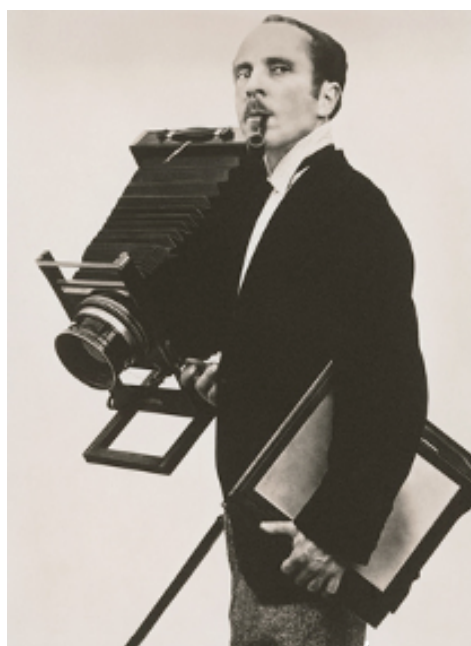
Tina Modotti, Edward Weston con su cámara (1924)