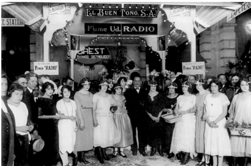
Stand de cigarrillos El Buen Tono en la Feria Radial de 1923

Cuando abordamos los estudios de medios nos enfrentamos a dos ejes problemáticos: la escasa presencia de ese corpus teórico en la currícula académica y las posibilidades de su articulación con los estudios estéticos y literarios. Máquinas de vanguardia. Tecnología, arte y literatura en el siglo XX , del mexicano